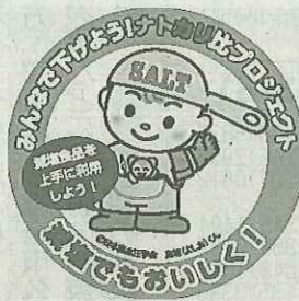
減塩食品を示すシール

健診では、野菜に多く含まれるカリウムと、食塩の摂取量も調べた。食塩の主成分のナトリウムの尿中への排泄を促し、血圧を下げる働きがある。結果は「不足」だった。