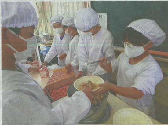
給食の主要「八寸」をよきう児童(広島県呉市で)

10月上旬、広島県呉市立広小の給食に、郷土料理「八寸」が登場した。旬の野菜、魚、昆布など、山の幸をふんだんに使った煮物だが、現在は地元でも家庭で作ることは珍しく、知らない子も多いという。