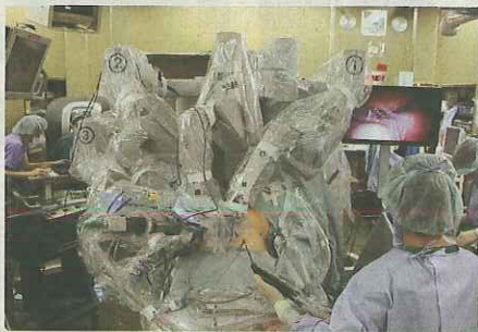
手術用ロボット「ダビンチ」を使って行う前立腺がんの手術

手術用ロボットは、手術器具の先端が自由自在に動き、体内で細かい作業ができる。前立腺の周辺にある組織の損傷を抑え、出血も少ない。