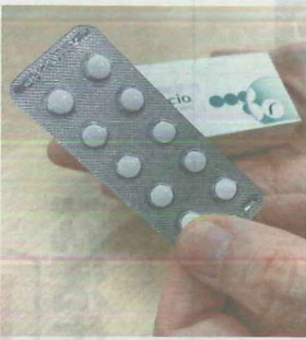
記者が飲んでいた「フィナステリド」の錠剤。個人輸入代行のサイトで購入していた

4までが正常値で、10までがグレーゾーン、10・1以上が「疑い」となる(単位はナ・タ/リ・タ)。私のPSA値は4・624