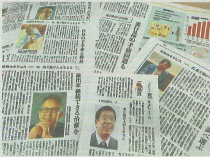
前立腺がんに関する読売新聞の過去記事。有名人の体験談に書かれていたグリソンスコアは人それぞれだった

最も多いがん細胞と、2番目に多いがん細胞のそれぞれのグレード(1〜5)の合計を求める。高いほど悪性度が高い