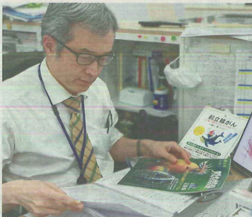
前立腺がんの資料に目を通す編集委員。治療法を集めることに実感を覚えた。

た。欧米では、手術や放射線、抗がん剤など各分野の専門医が協議し、ガイドライン(診療指針)を定める。しかし日本では、日本泌尿器科学会が診療指針の作成を主導し、他科の医師の参加は多くない。放射線治療医の数自体も少ない。